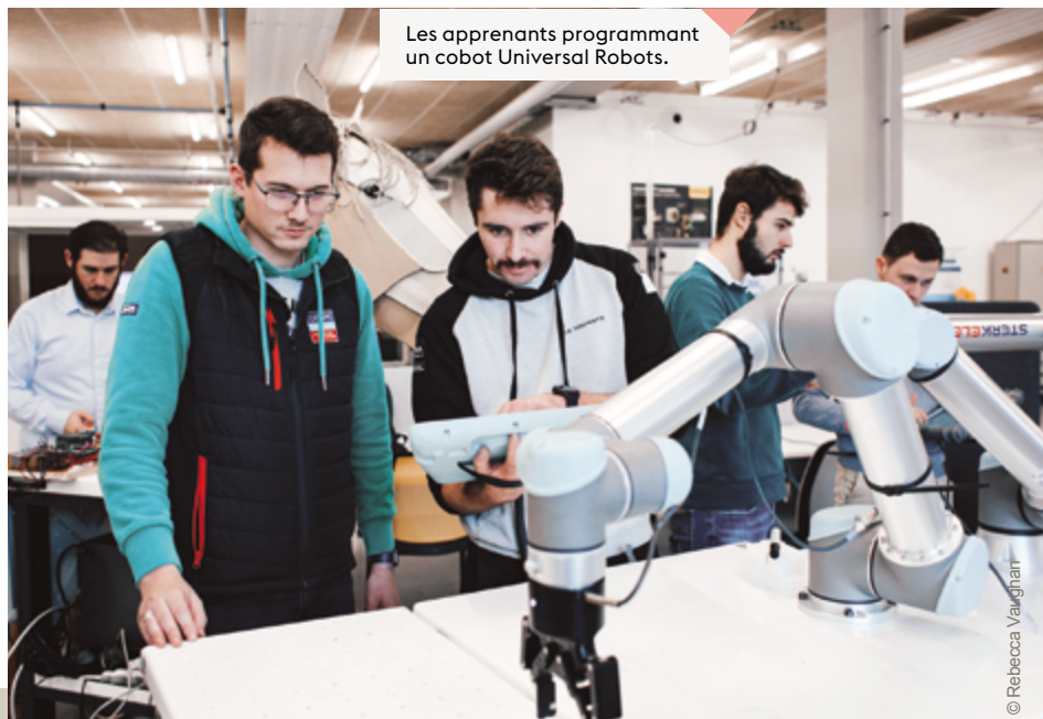
Les apprenants programmant un cobot Universal Robots.