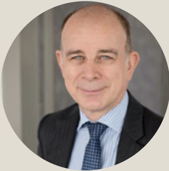
ALAIN ROUMILHAC PRÉSIDENT DE MANPOWERGROUP FRANCE